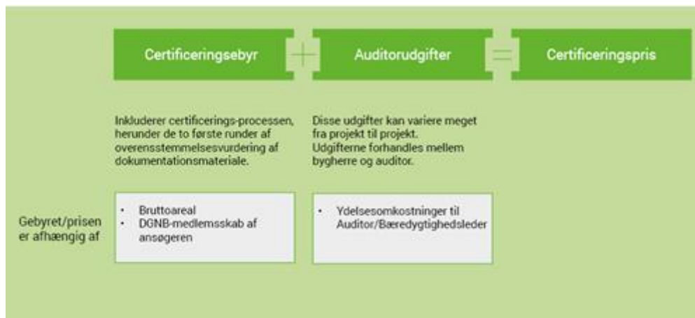
Figur: Priselementer ved DGNB-certificering

En DGNB-certificering fungerer også som et effektivt procesværktøj for bygherren og de andre involverede parter. Den generelle feed-back fra erfarne bygherrer er, at der er effektivisering og hermed besparelser at hente netop i kraft af proces-effekten.